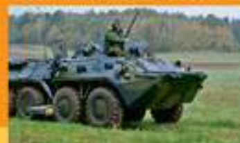
ВРУЧЕНИЕ Личному СОСТАВУ ВООРУЖЕНИЯ И ВОЕННОЙ ТЕХНИКИ