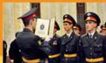
ПРИВЕДЕНИЕ К ВОЕННОМУ ПРИСЯГЕ