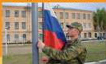
ПОДЪЕМ И СПУСК ГОСУДАРСТВЕННОГО ФЛАГА РФ