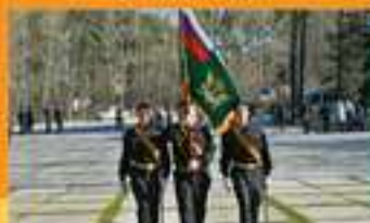
ВРУЧЕНИЕ БОЕВОГО ЗНАМЕНИ ВОИНСКОЙ ЧАСТИ